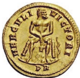
Keerzijde van een aureus van Maximianus Herculius (286-305) 8

Het door mij bestudeerde stuk is van hetzelfde type als de vondst uit