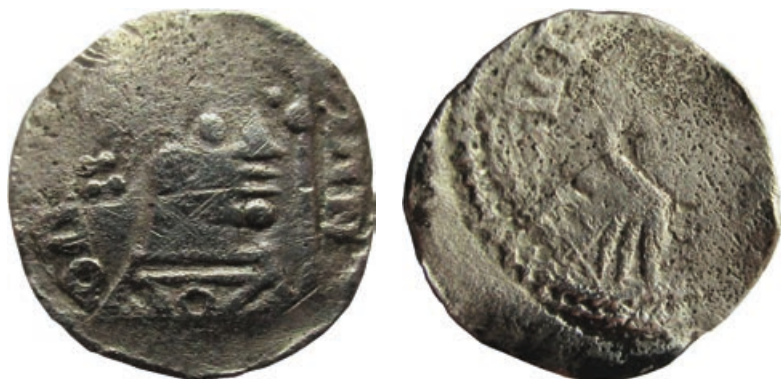
Het vondstexemplaar van Koninksem (dubbele grootte)